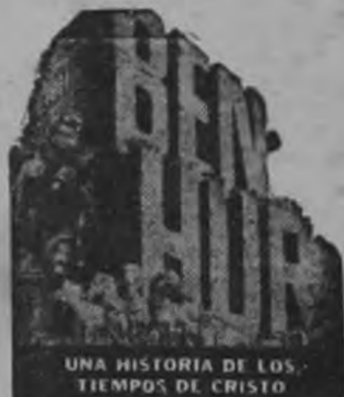
UNA HISTORIA DE LOS TIEMPOS DE CRISTO